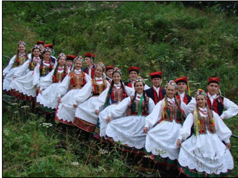
Zespół Regionalny Mietniowiacy