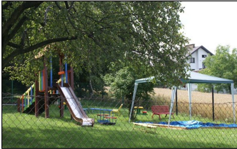
Przedszkole w Mietniowie