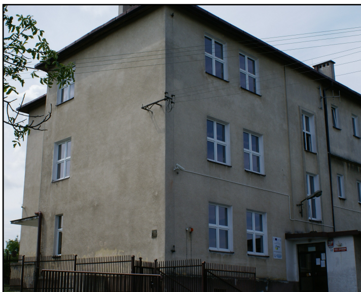
Budynek szkoły podstawowej

Atutem Mietniowa jest niewielka odległość od Wieliczki i Krakowa oraz dobre połączenie z tymi miastami. Przez wieś kursują trzy linie busów, a dojazd do Krakowa zajmuje 40 minut.